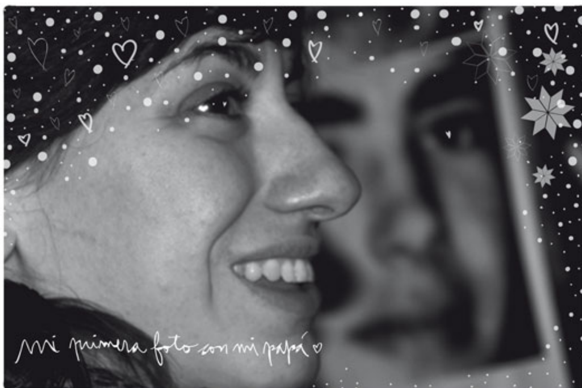
Figura 2. Diario de una princesa montonera.